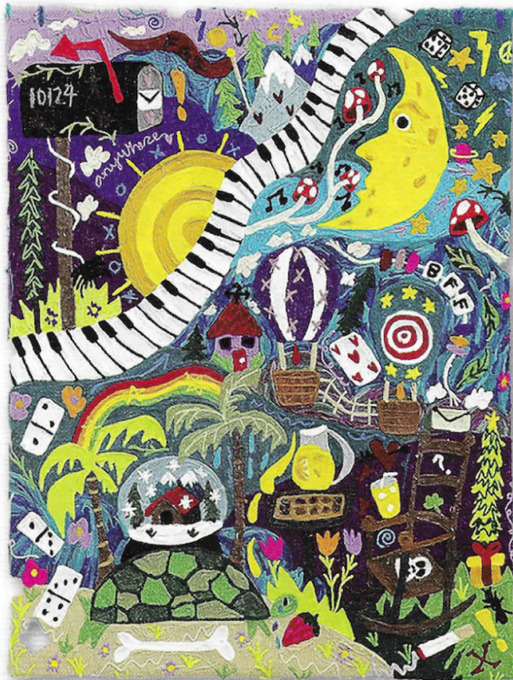
Lemonade Stand, 2023, 91 x 122 cm, arens geborduurd op vilt.

De constante kleurwisselingen op de naaimachine en het nauwkeurig vullen van de uitgetekende vlakken, die ze eerst vol legt met dikker draad in de juiste kleur, dat ze daarna met naaisteekjes vastzet, vormen een intensief proces waar Kaylie per werk