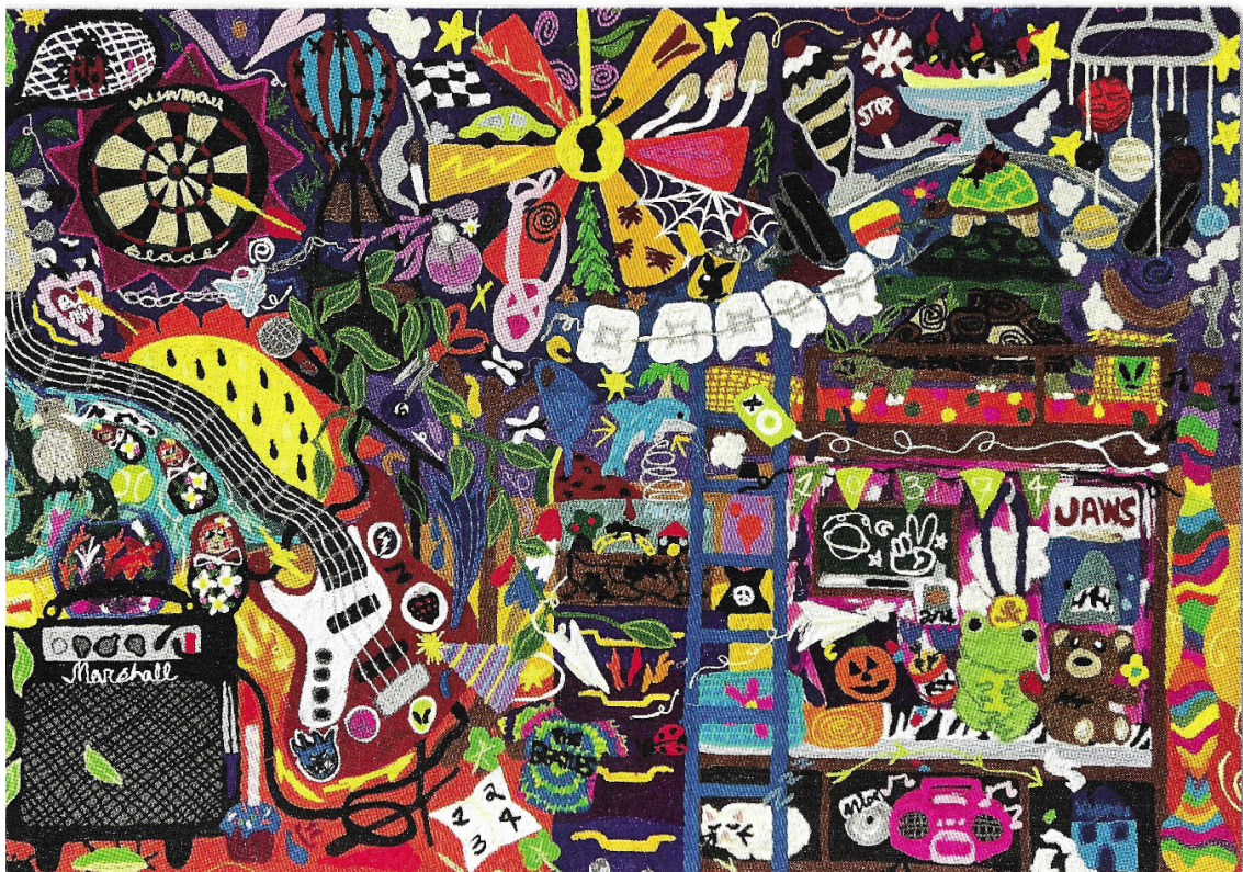
Sleeping Pills, 2024, 122 x 183 cm, garens geborduurd op vilt